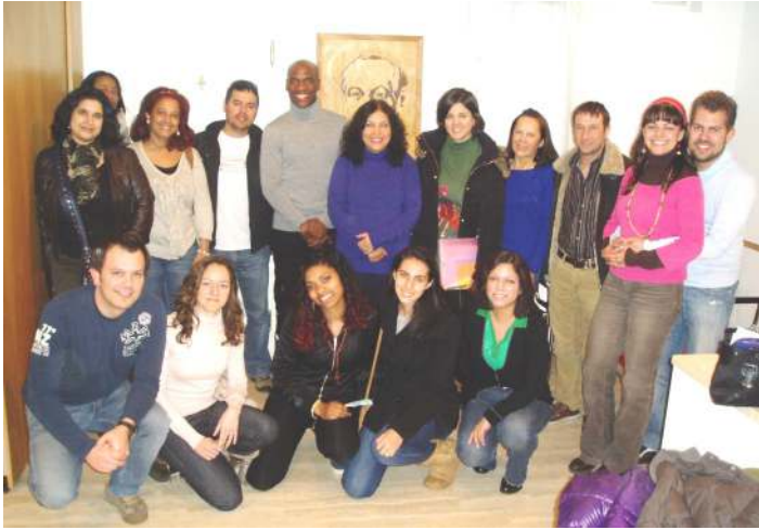
Participantes en la mesa redonda sobre la experiencia de la fe. Zona Pastoral. Confirmación de adultos.

En la Hoja Informativa de enero anunciábamos la oferta de preparación para el sacramento de la Confirmación para adultos.