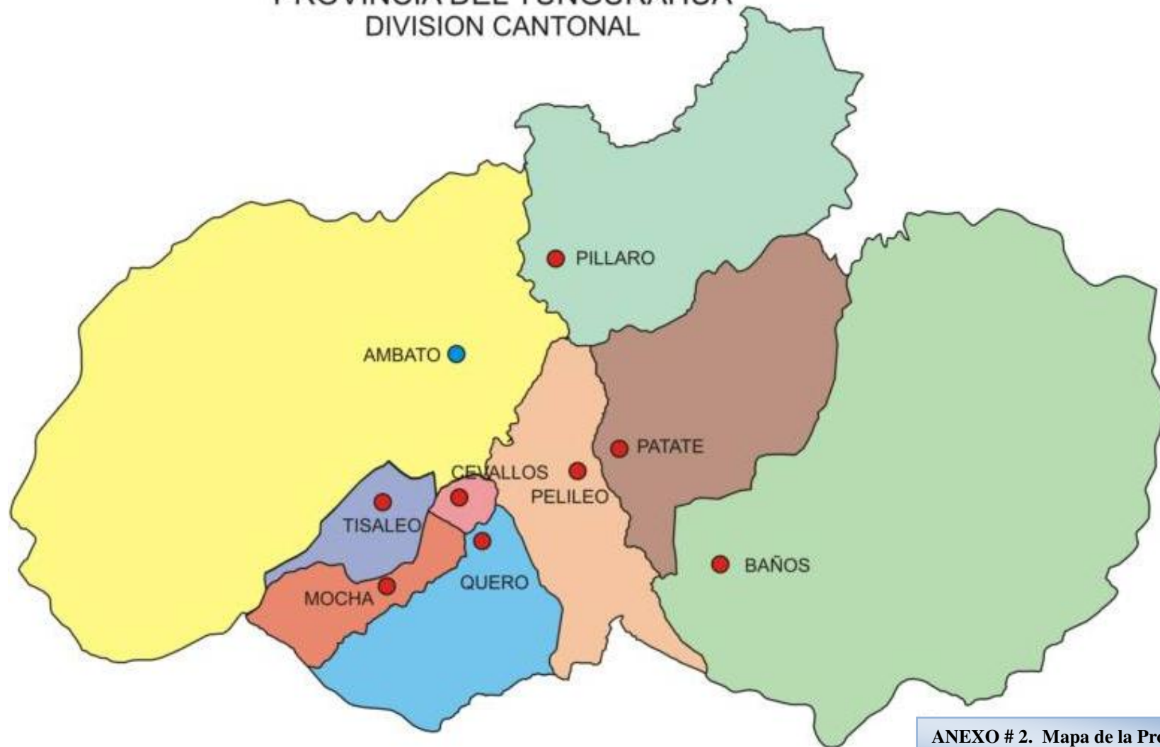
ANEXO # 2. Mapa de la Provincia del Tungurahua y sus Cantones