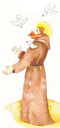
S. Francisco de Asís

Porque dando es como se recibe; olvidando, como se encuentra; perdonando, como se es perdonado; muriendo, como se resucita a la vida eterna.