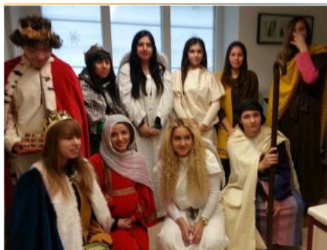
FIESTA DE NAVIDAD de la Catequesis