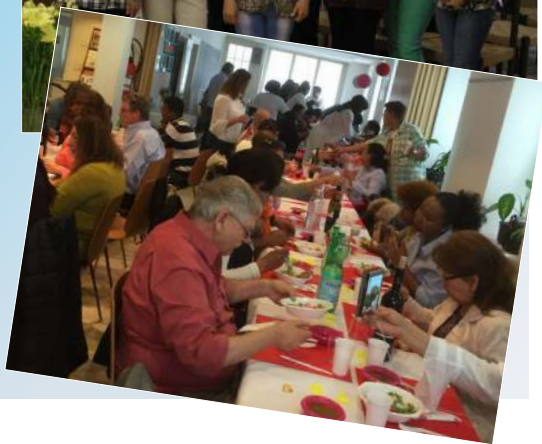
Fiesta de la Divina Misericordia (Sede de Zürich)