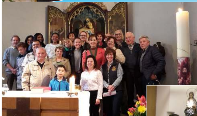
Pascua de Resurrección (Niederhasli)