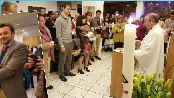
Vigilia Pascual (Capilla de Zürich)