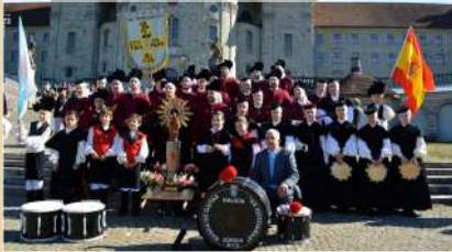
As Xeitosiñas Banda de Gaitas e Grupo de Danzas

Sporthalle Unterrohrstrase, 2 Schlieren, Zürich Entrada gratis!!!