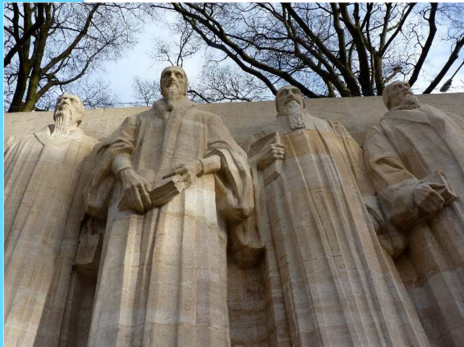
Monumento a los Reformadores. Ginebra

“Aprovechemos todas las oportunidades que la Providencia nos ofrece para rezar juntos, anunciar juntos, amar y servir juntos, especialmente a los más pobres y abandonados”. (Papa Francisco)