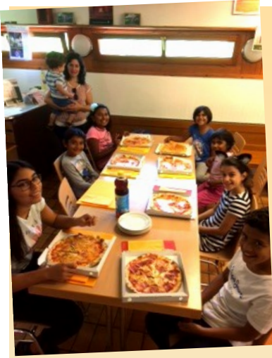
Encuentro festivo de los “minis” a finales de agosto en Kloten

La Misión acudió el 18 de setiembre a la cita de la ciudad de Zúrich con las organizaciones que trabajan con gente de lengua hispana