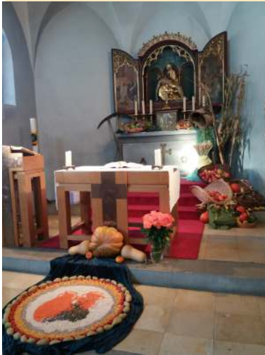
La parroquia de Niederhasli celebró su fiesta el día 1 de octubre. Nuestra Misión participó con renovada ilusión.

El grupo de mayores de Winterthur pasó un día de convivencia en Lugano el 28 de setiembre.