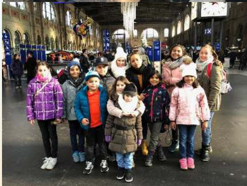
Visita al mercado navideño de Einsiedeln y a Zürich de los “minis” y los niños y niñas de la formación cristina de Kloten .