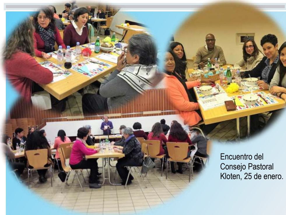
Encuentro del Consejo Pastoral Kloten, 25 de enero.