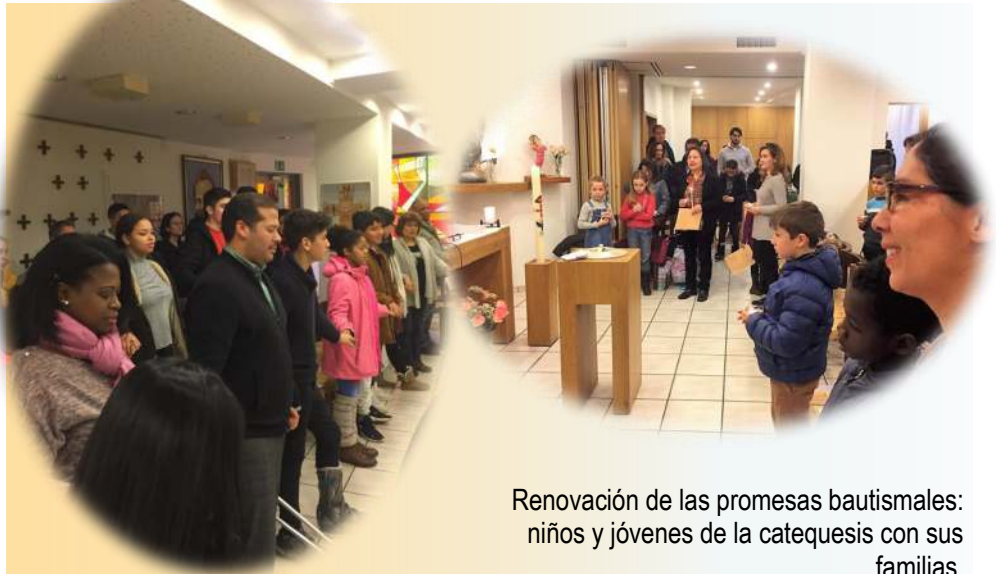
Renovación de las promesas bautismales: niños y jóvenes de la catequesis con sus familias.