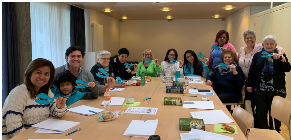
Retiro de Cuaresma en Winterthur.

Curso-Taller: "Haciendo cuentas... la vida es un regalo" (Equipo del PAF) una iniciativa de: el Ateneo Popular Español, el Centro Social de Mayores Esperanza y la Misión Católica de Lengua Española