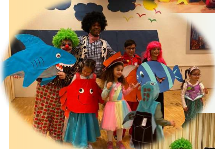
Fiesta de Carnaval en Winterthur