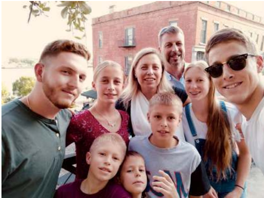
Familia Da Ponte, Venecia (Italia) - Bridgeport (Estados Unidos)